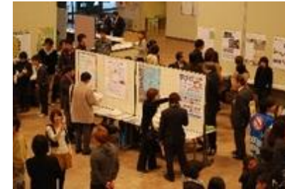
【環びわ湖大学地域交流フェスタ2010】

本学は、環びわ湖大学・地域コンソーシアムの大学地域連携事業委員会の委員長校として、県内自治体等との密接な連携のもと、継続的な実施に関する基礎的枠組みを構築した。それを踏まえて地域と大学の連携事業に関する発表会・交流会である「環びわ湖大学地域交流フェスタ2010」を12月11日に本学で開催し、県内大学、自治体、地域から約250人の参加を得た。