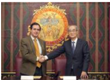
[セビーリャ大学（スペイン）と学術交流協定]

また湖南師範大学および湖南農業大学とは、平成 24 年度の協定改更に向けた予備交渉を開始した。