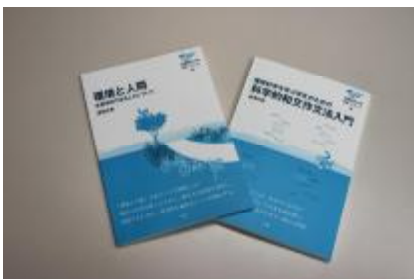
[滋賀県立大学環境ブックレット 第4巻・第5巻]