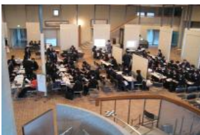
[就職活動応援セミナー]

また、キャリア形成科目として「キャリアデザイン論」を平成23年度から開講することとした。