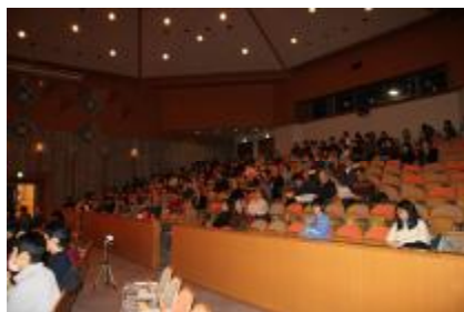
[脇田晴子先生文化勲章受賞記念講演会]